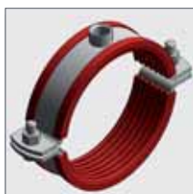
Titan HD con Inserto in Silicone*