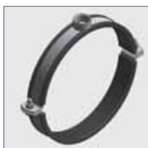
Titan HD con Inserto in Gomma