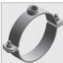
Titan HD senza Inserto