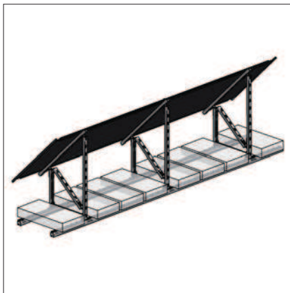
In elevazione, inclinato di 45°