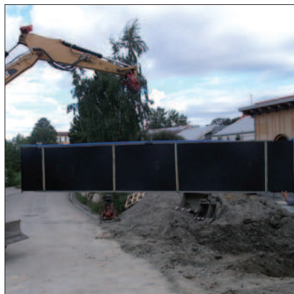
Installazione in verticale nel terreno